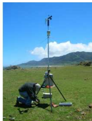
Estación de Isla Mocha

El Experimento Chileno sobre Surgencia (CUPEX por Chilean Upwelling Experiment), es un esfuerzo de varias universidades e investigadores de diferentes disciplinas que quieren estudiar la interacción que existe entre el océano y la atmósfera en la escala espacial y temporal de la surgencia costera. Hay muchas preguntas que responder, pero en particular, los primeros esfuerzos se han focalizado en observar un chorro de viento asociado a las puntas de las bahías de Tongoy y del Golfo de Arauco, que podría tener repercusiones en la surgencia y en las corrientes dentro de estas bahías.