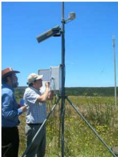
Estación de Lebu